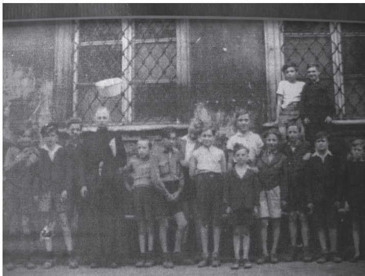
Ministranci w roku 1947

W uzupełnieniu niniejszej korespondencji dodajmy, że na prezentowanym zdję-