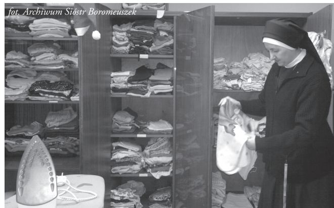
fol. Archiwum Sióstr Boromeuszek

marzyć od lat: szkoła medyczna i szpital położniczo-ginekologiczny. Zbliży się kanonizacja Jana Pawła II. Może byłaby to dobra okazja, by także wrocławianie i Dolnoślązacy uczcili Papieża-Polaka godnym, żywym Pomnikiem – dziełem, które będzie służyło życiu od poczęcia po kres. Po-