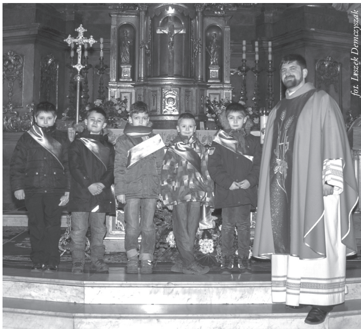
Kandydaci na ministrantów

„Ministrant” (z łaciny) znaczy „służyć”. Służymy Bogu, kiedy przyczyniamy